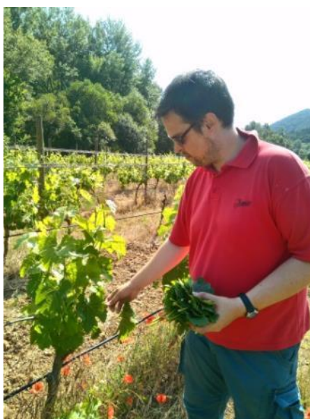
Imagen 10: Recogida de hojas para análisis foliar

Se llevó a cabo el seguimiento de la fertilización de un total de 197 viñedos de la región del Priorat. A partir de los resultados analíticos de las muestras, VITEC envió un total de 54 informes técnicos con recomendaciones precisas de dosis de fertilizantes a aplicar.